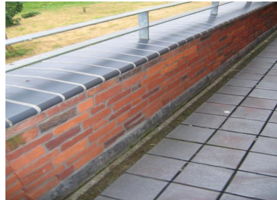
Binnenkant van borstwering die niet of nauwelijks nat wordt

noodzakelijk. Voor de waterdichtheid van de aansluiting met het dak kan dan een loodslabbe worden ingemetseld, die de naad tussen dakbedekking en muur afdekt. Regenwater dat via het buitenspouwblad doorslaat zal net als bij het overige gevelmetselwerk via de luchtspouw zijn weg vinden naar de openstootvoegen ter plaatse van de waterkeringen.