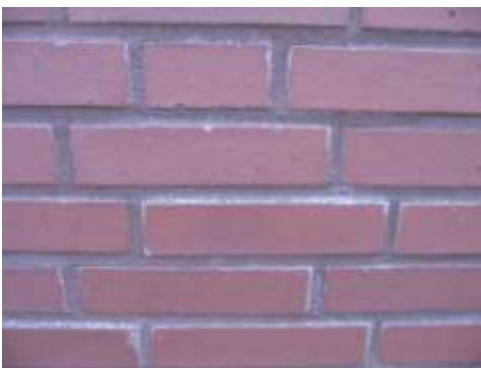
Smetranden door metselmortel

Wanneer een voegmortel op kleur gewenst is dan is het ter voorkoming van smetranden op de stenen aan te bevelen om ook de metselmortel op kleur van de voegmortel te kiezen.